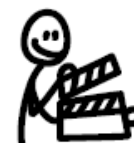
Tomador de decisões