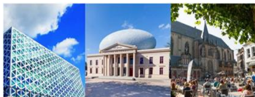
Ties that Bind for Social Work: Late Modernity, Social Capital and Community

POWER zal ook daar gepresenteerd worden. Centrale thema's zijn: belang van sociale netwerken en mantelzorgers, internationaal onderzoek binnen maatschappelijk werk, uitdagingen maatschappelijk werk in de hedendaagse moderne maatschappij.